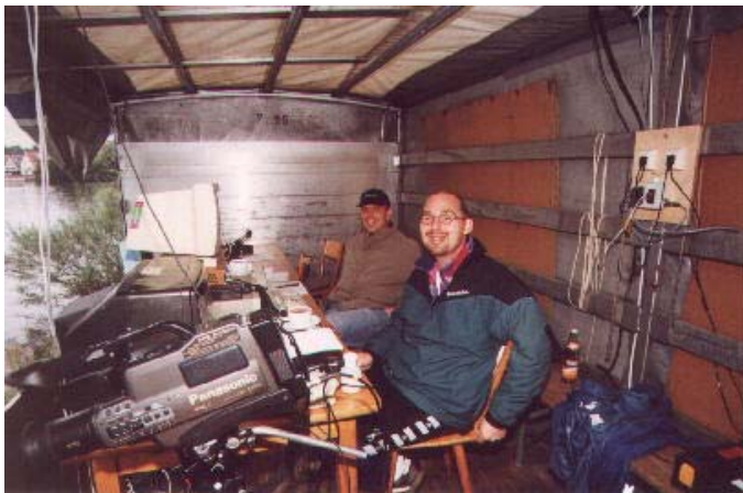
Ein eingespieltes Team beherrscht die Regattatechnik, die während der Veranstaltung auf einem LKW untergebracht ist.