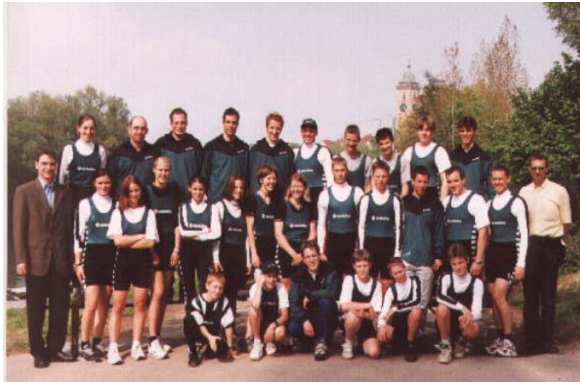
Die Trainingsmannschaft des Ruderclubs Nürtingen stellte sich zu Saisonbeginn 2000 gemeinsam mit dem Trainerteam dem Fotografen. Es folgte ein erfolgreiches Wettkampffahr.